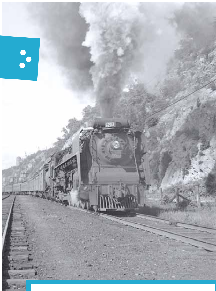
L'Express Maritime quittant Lévis dans les années 1940. Aujourd'hui, ce même endroit est occupé par le Parcours des Anses.