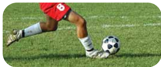
Cahier A: Programme loisirs printemps 2007