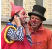
Clown de père en fils, présenté par les Productions Rêves en Stock