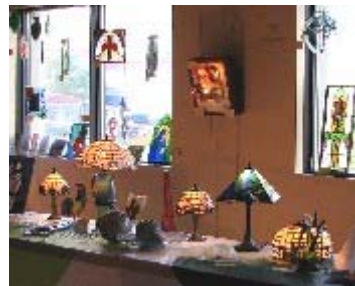
Oeuvres des cours de vitrail

Plus de 350 personnes ont assisté le 23 mai dernier au CRBlais, au vernissage de la 18e édition de cette exposition regroupant les œuvres des quelques 150 élèves inscrits à l'École des arts de la Rive-Sud. Nous tenons à féliciter les élèves participants et la récipiendaire du concours de l'œuvre promotionnelle Maude Bonneau-Dumas, 12 ans, pour sa peinture intitulée « Venise ».