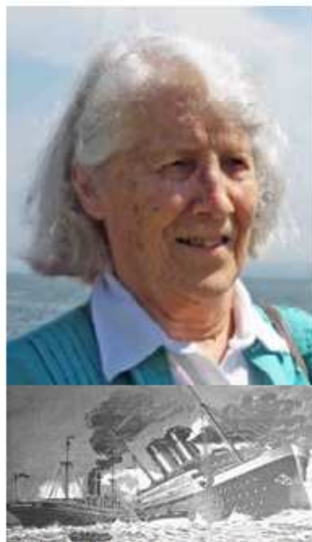
Détails de la programmation au www.acdavie.com