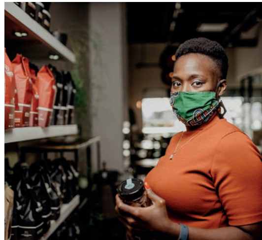
Ville de Lévis