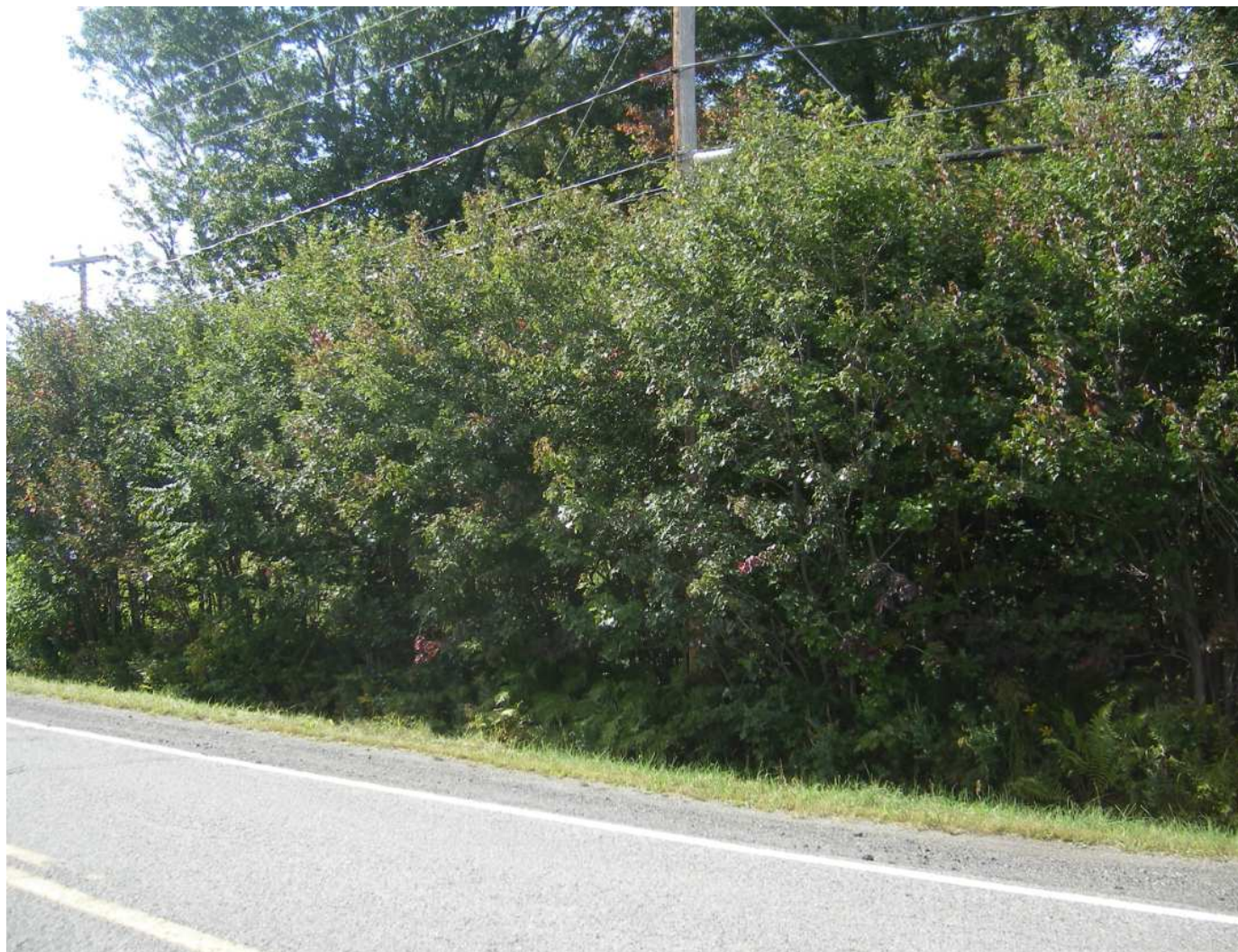
Photo du terrain