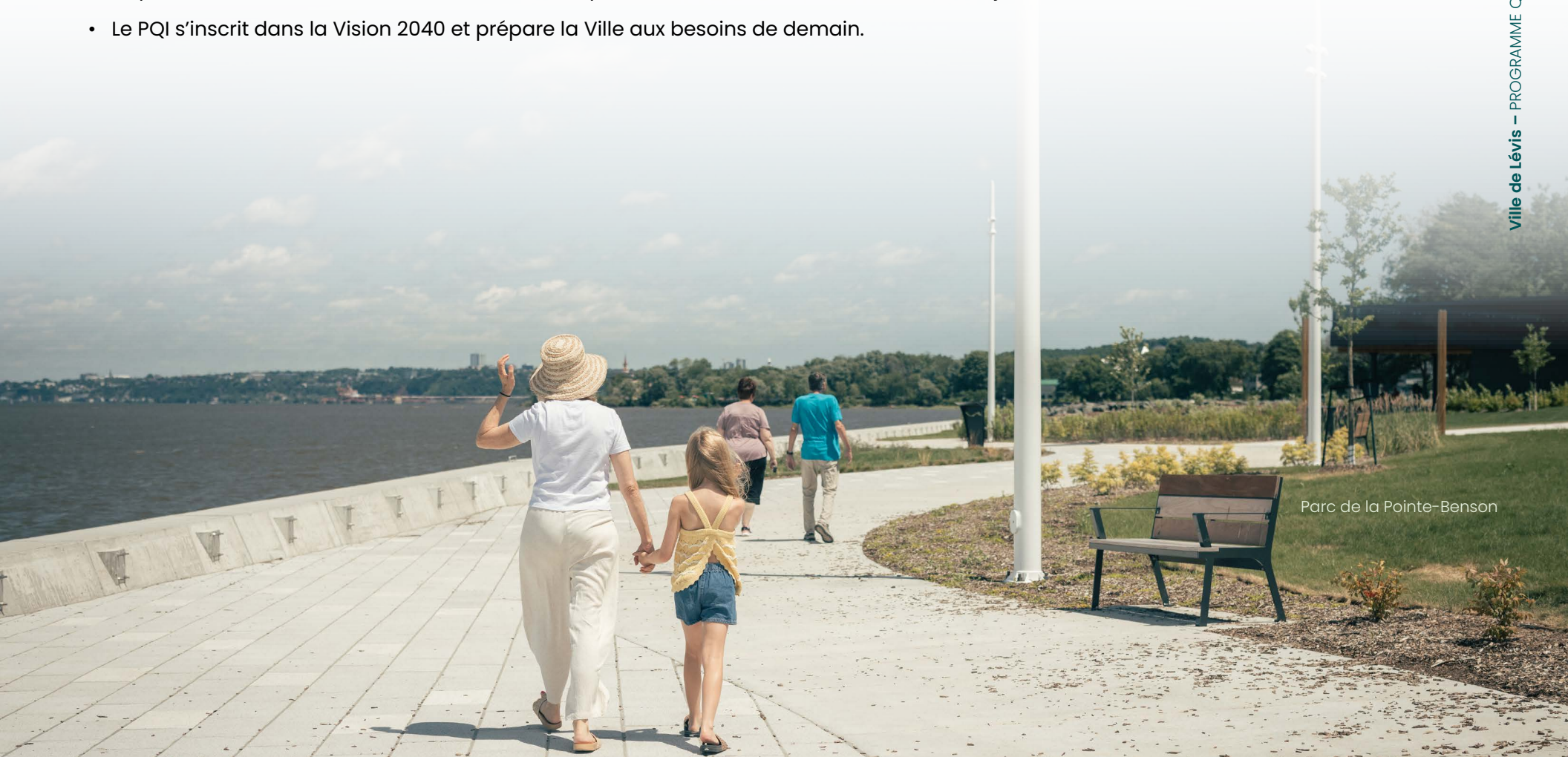
Parc de la Pointe-Benson