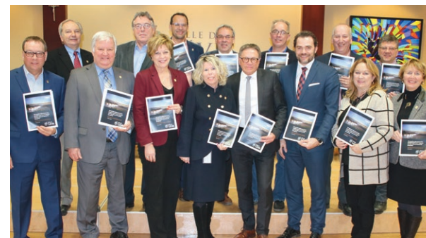
Les membres du conseil municipal et le directeur général de la Ville de Lévis, le 19 janvier dernier, lors de la présentation du bilan 2016.