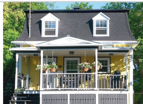
Prix Coup de cœur des Prix du patrimoine 2015 de Lévis, remis à madame Sheila Badeau pour la rénovation de sa résidence de la rue Barras.

L'événement local des Prix du patrimoine se tiendra le 20 avril 2017. De plus, le 17 juin, Lévis sera la ville hôte de la journée Célébration patrimoine 2017, qui regroupe tous les lauréats des régions de Québec et Chaudières-Appalaches.