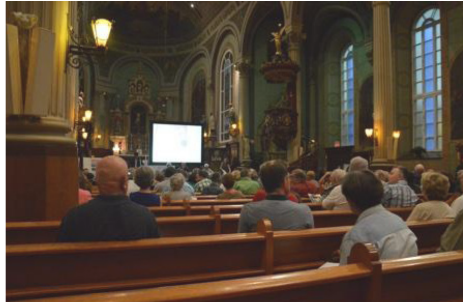
© Érick Deschênes/Journal de Lévis, 2015

Entre ces deux axes est-ouest, en plein coeur du Vieux-Saint-Romuald, la remarquable église classée patrimoine culturel du Québec s'impose comme un solide phare qui résiste à l'usure du temps, et comme le symbole d'un quartier dont l'âme endormie n'attend qu'un nouveau son de cloches.