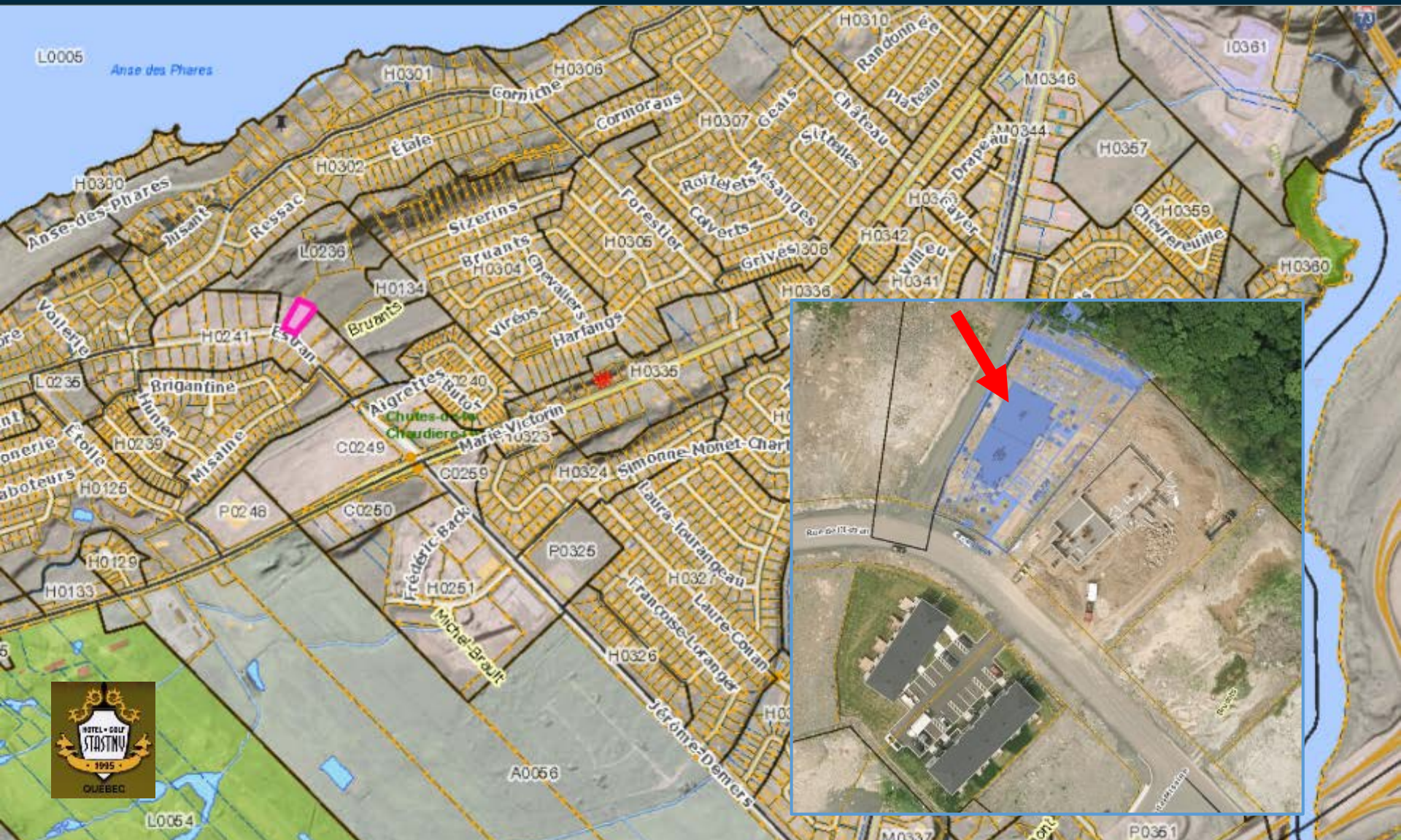
Terrain visé - Localisation