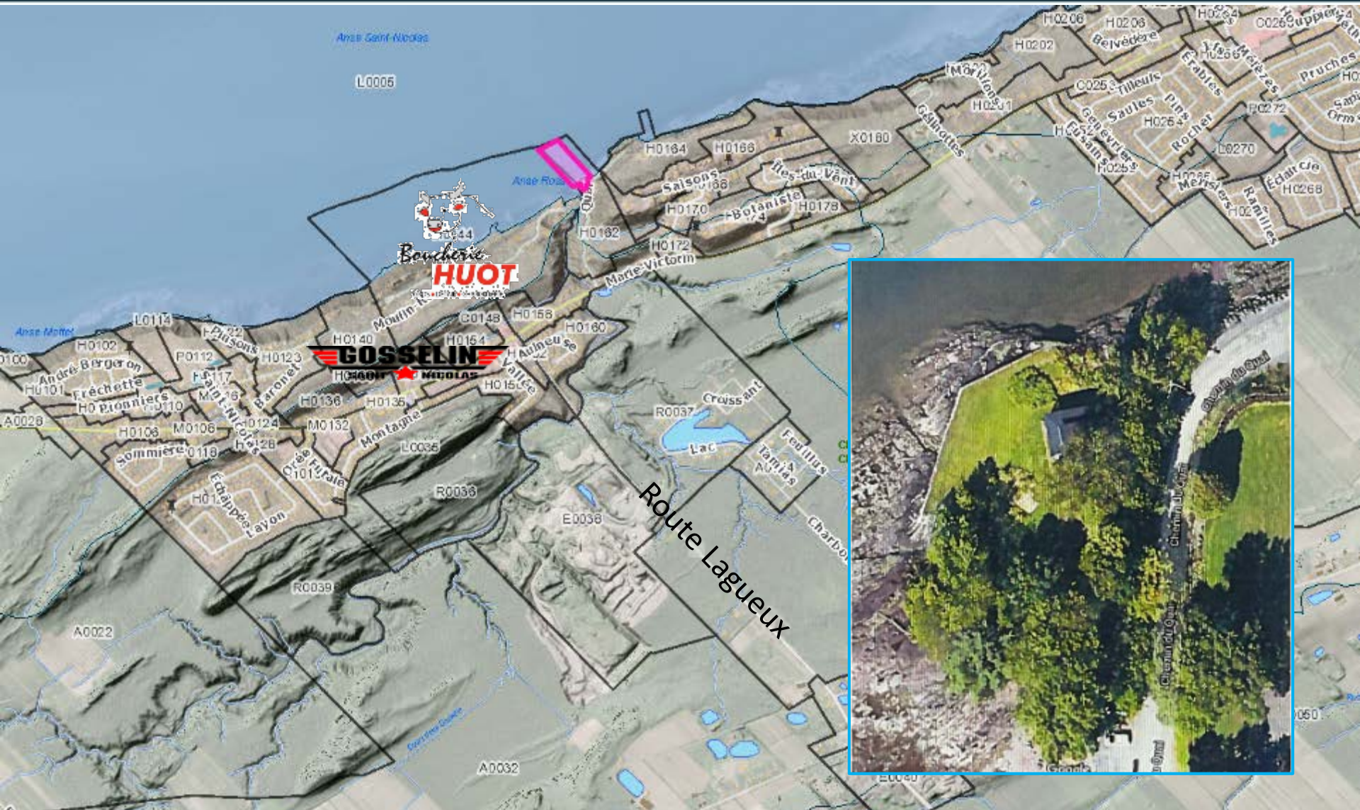
Terrain visé - Localisation