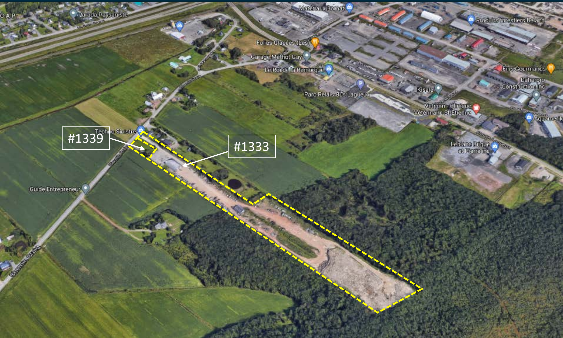
Localisation (Google Earth)