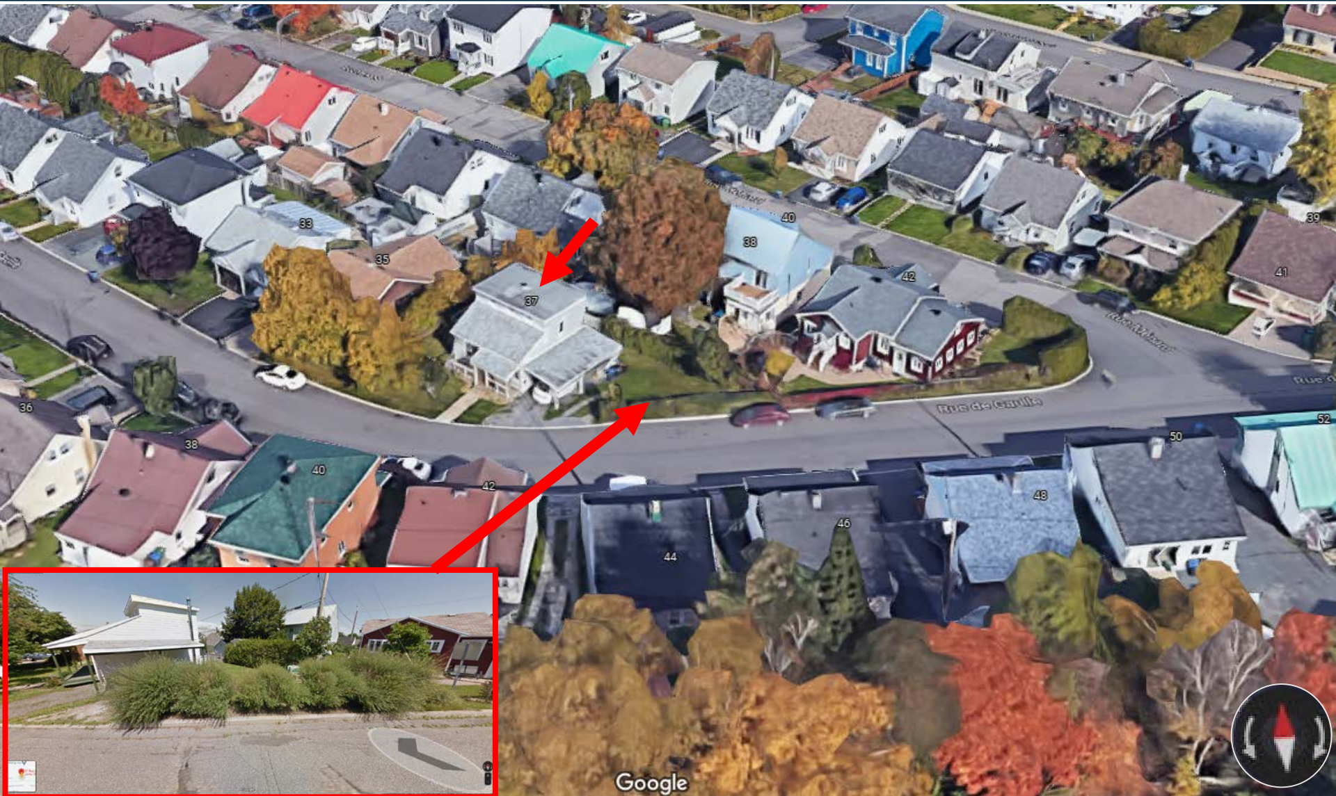
Localisation (Google Earth)