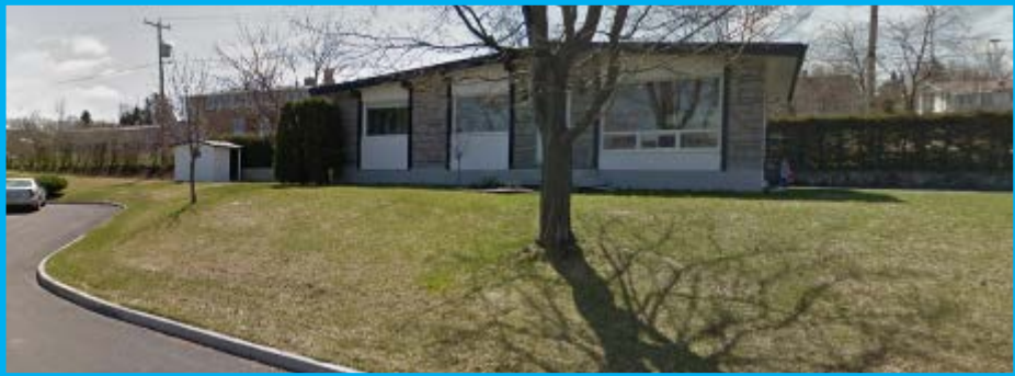
Localisation et bâtiment visé