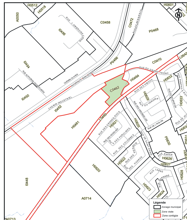
Plan zone C0462 - RV-2016-16-22

Les cartes de localisation mentionnées pour certains avis publics peuvent être consultées en téléchargeant la version électronique du Cahier municipal et avis publics du site Internet de la Ville de Lévis, à l'adresse ville.levis.qc.ca .