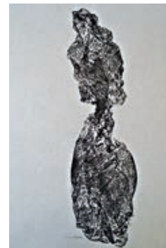
Requiem, par France Lacroix

Vous êtes également invités à vous abonner aux alertes de contenu au ville.levis.qc.ca/alertes afin d'être informés en temps réel d'une actualité municipale, notamment une situation d'urgence comme une inondation.