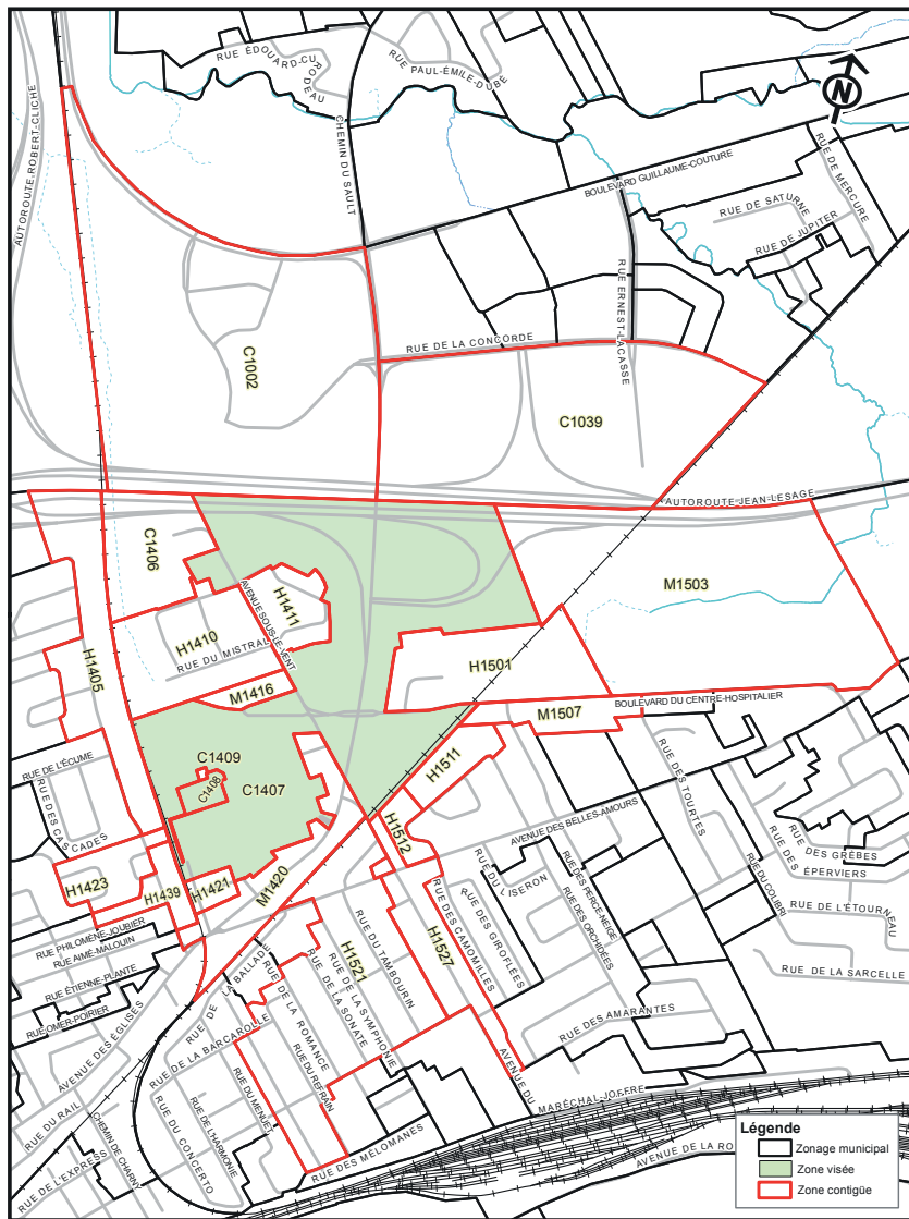
Croquis des zones C1408, C1409 et C1407 avant modification - RV-2016-15-79